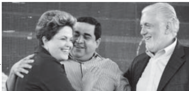
Presidenta Dilma, prefeito Demir e o governador Jaques Wagner

Segundo dados do Tribunal Regional Eleitoral (TRE-BA), Rui Costa recebeu 3,55 milhões de votos no Estado, enquanto Souto alcançou 2,44 milhões. A senadora Lídice da Mata (PSB) terminou a eleição com 432 mil votos (6,62%). A disputa para